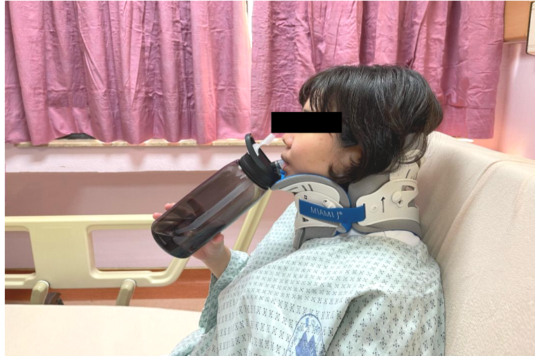
圖九進食需搖高床頭