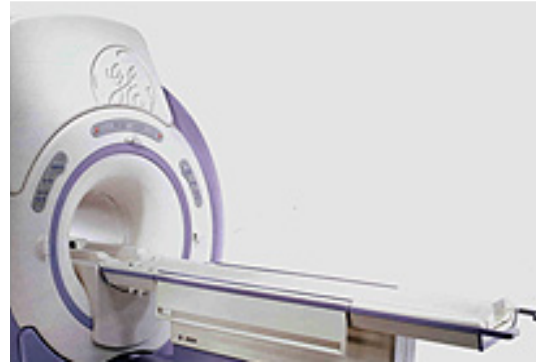
圖二 電腦斷層檢查