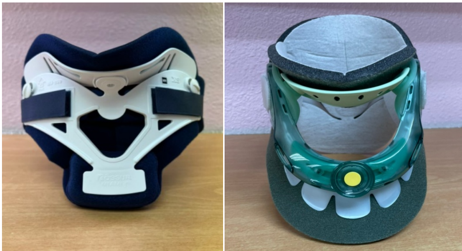
圖四邁阿密頸圈圖五 Vista 頸圈

(一)由醫師評估手術後所需的頸圈種類，如圖四、圖五；術後需持續穿戴，以固定頸部預防脫位。