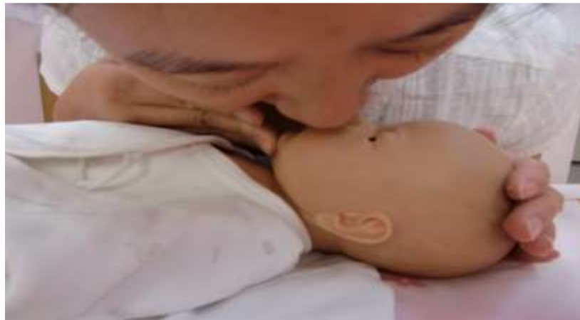
圖五、蓋住口鼻吹兩口氣