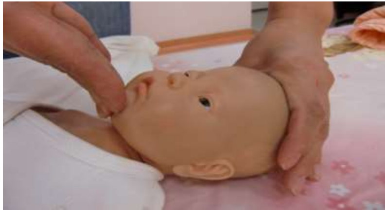
圖三、壓額頭抬下巴法