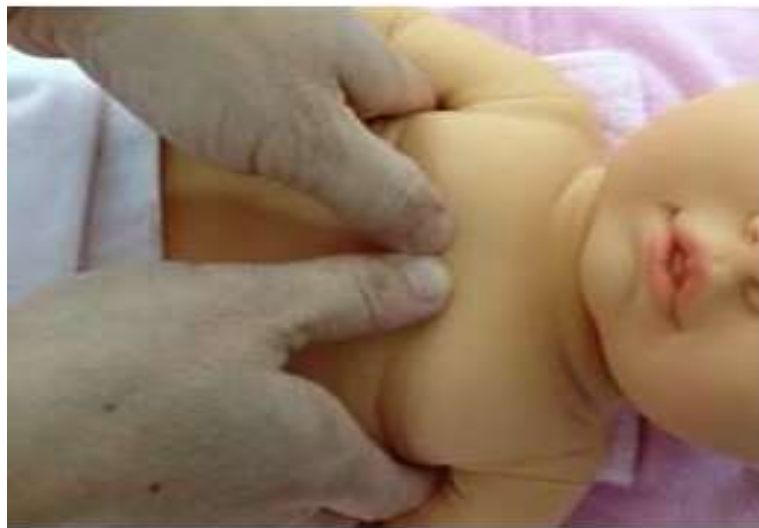
圖二、拇指併排下壓兩乳頭連線中央