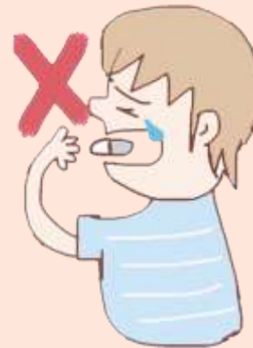
無法吞嚥膠囊內視鏡 及無法配合穿戴者