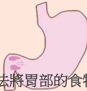
無法將胃部的食物推 到小腸