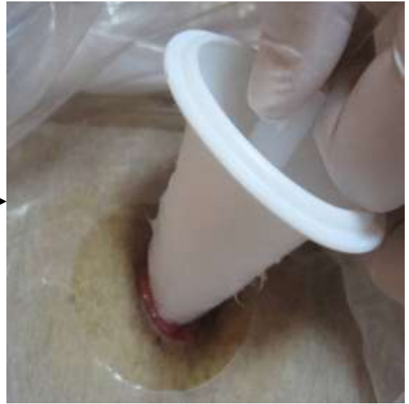
圖七 將錐形頭順著腸道輕插入 人工肛門，輕輕固定。