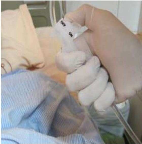
圖六 排空灌洗袋子內的空氣。