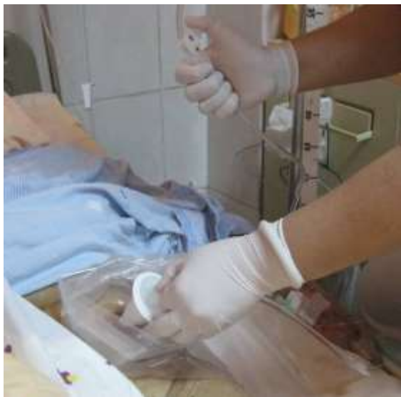
圖八 打開流量控制器，流速 100cc/分緩慢進入腸內， 並注意反應，灌洗後等3-5 分鐘才拔出灌洗頭。