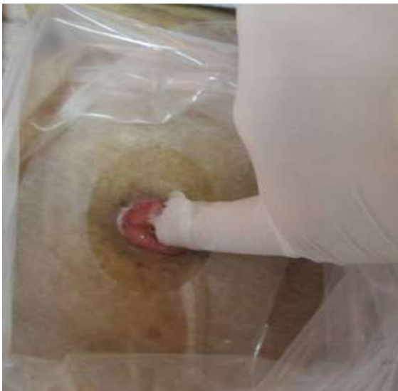
圖四 以小指或食指沾潤滑劑試探腸道方向並予擴張。