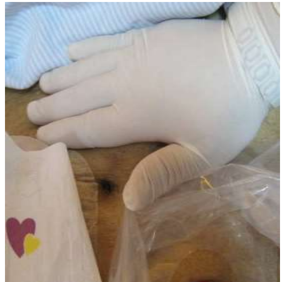
圖九 灌洗間隔10-15分鐘，可 下床走動或以手順時鐘方 向輕輕按摩20分鐘。