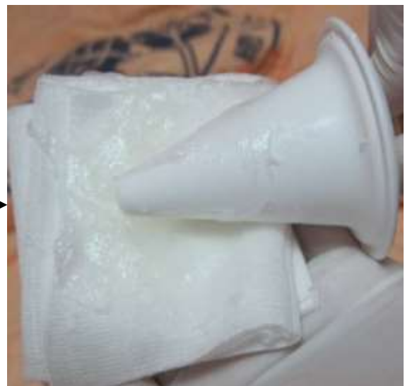
圖五 將潤滑劑塗抹於錐形頭上。