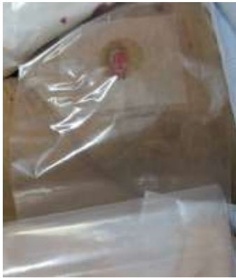
圖一 將便袋換成人工肛門沖洗袋。