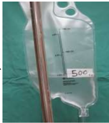
圖二 將 500c. c. 溫水 (36-38°C) 裝入灌洗袋。