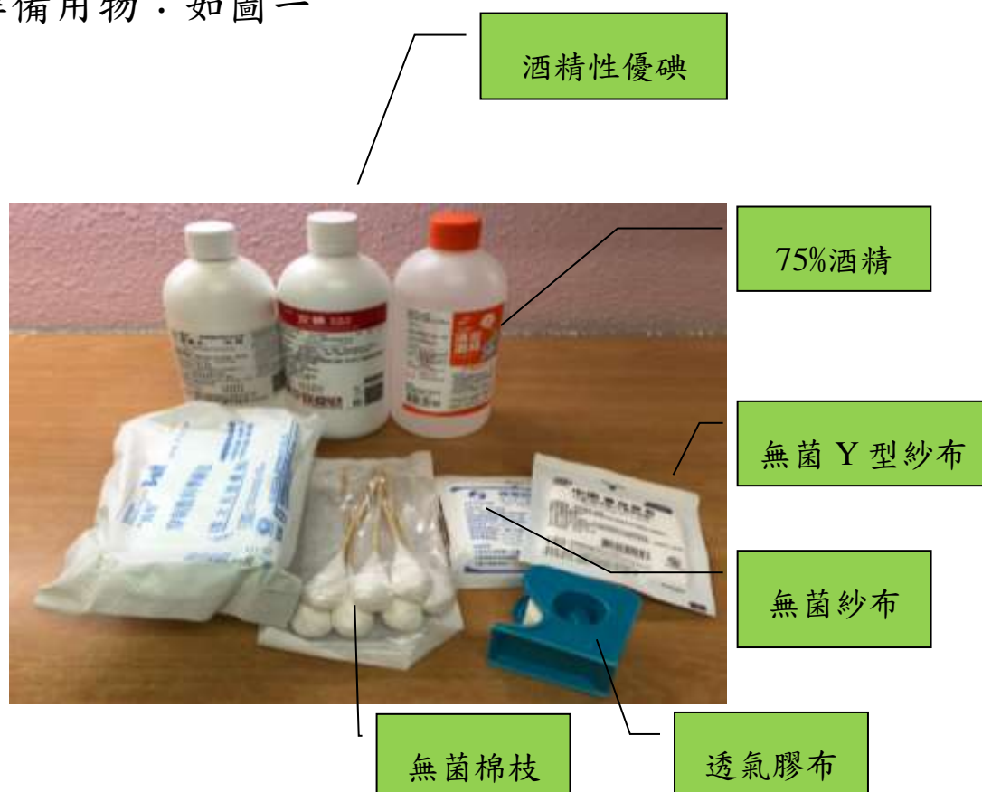
圖一 外固定護理準備用物