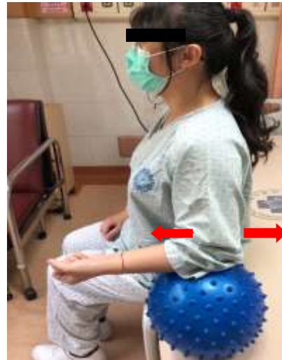
往前、後、內、外側運動