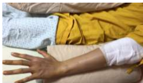
手指伸直放鬆維持 5 秒