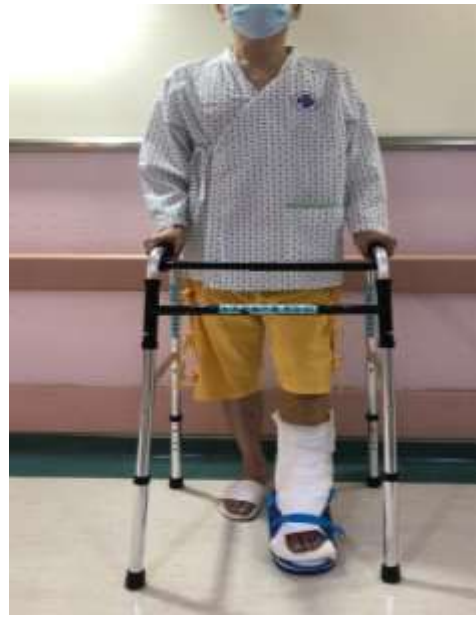
圖二 使用助行器行走