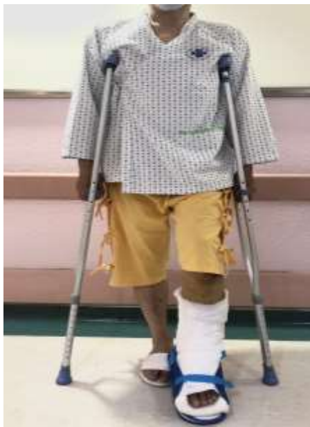
圖一 使用柺杖行走

骨折是骨科常見的傷害。醫師會詳細檢視 X 光片及受傷情形以獲得正確之診斷。治療上會施行手術將骨頭斷掉的地方接合在一起，並視需求以鋼板、髓內釘或鋼釘固定。下肢骨折在手術後通常受傷的肢體不能完全負重，必須借助柺杖或助行器走路（如圖一、圖二），直至醫師告訴您不需使用柺杖或助行器為止。