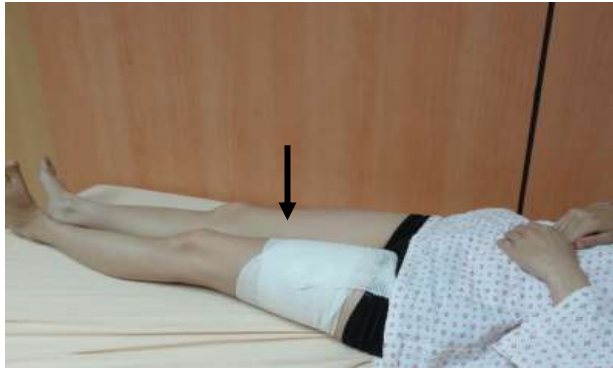
平躺，將腳板往上彎