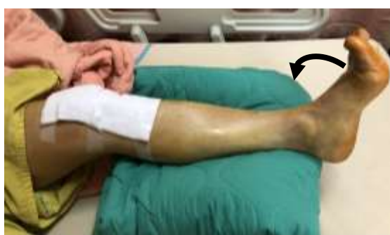
足背向上拱起維持 5 秒