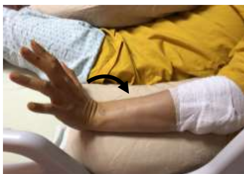
手掌背向上拱起維持 5 秒