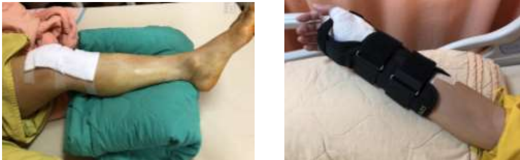
圖四 抬高手術的肢體

(四)手術後開始每 2 小時翻身一次，第一天開始每天要搖高床頭至少 3 次，以做為日後下床的準備；進食時也要搖高床頭以避免噎到。