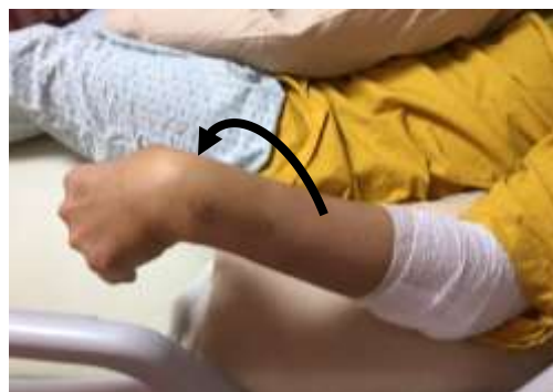
手掌向下拱起維持 5 秒後放鬆