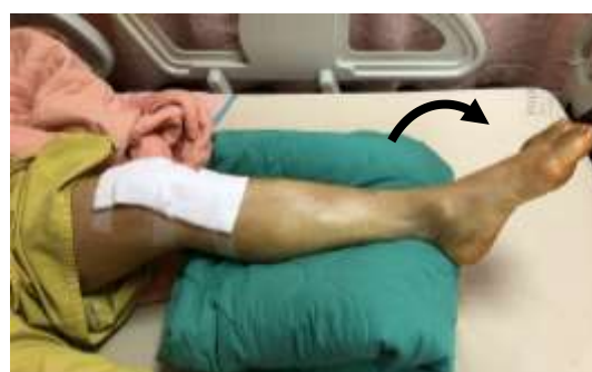
足背向下壓維持 5 秒後放鬆