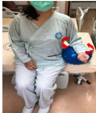
肘關節做順或逆時鐘旋轉