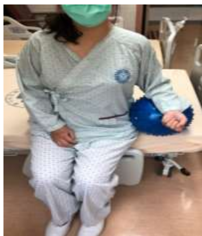
將手肘輕放在球上