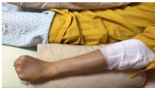
握拳維持 5 秒