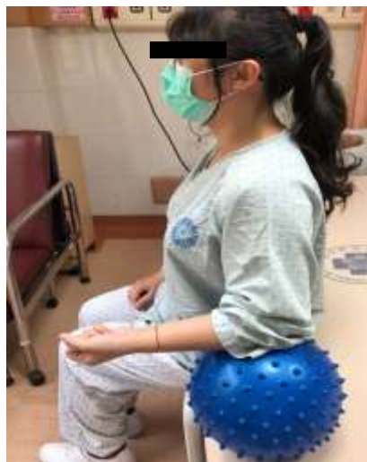
將手肘輕放在球上