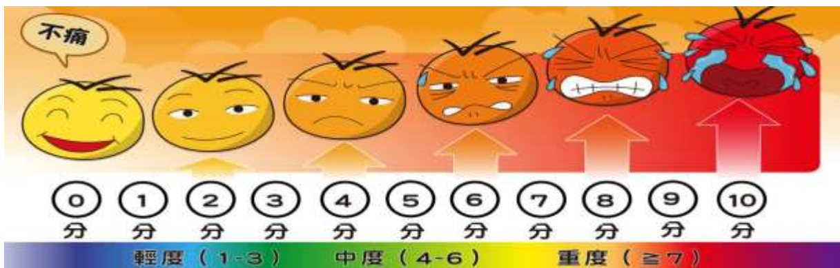
圖三疼痛評估量表