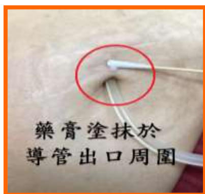
圖五、抗生素藥膏使用

(三)以乾燥棉籤沾約米粒大小之抗生素藥膏(圖五)，塗抹薄層在導管出口周圍，接著使用紗布覆蓋並將導管採U型固定貼牢(圖六)。