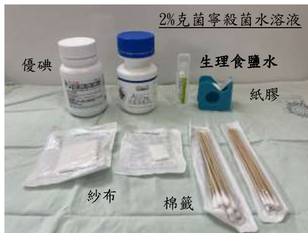
圖二、消毒所需用物

(一)洗手、戴口罩，將消毒所需用物(紗布、棉籤、膠布、 2% 克菌寧殺菌水溶液或優碘及生理食鹽水)放置清潔桌面(圖二)，移除原來的髒敷料後再洗手，觀察導管出口處有無紅腫熱痛情形。