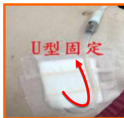
圖六、導管固定方式