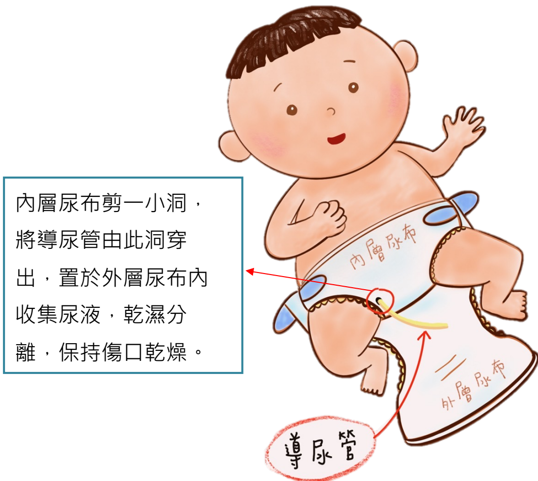
圖四、雙層尿布的包法

(三) 傷口敷料不需每天更換，如有敷落脫落等情形才需更換。尿片採兩件式包裹，內層尿片剪一小洞，將導尿管由此洞穿出，置於外層尿片內收集尿液，乾濕分離，保持傷口乾燥，減少污染(如圖四：雙層尿布的包法)。