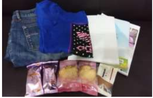
住院期間所需之衣物、零食