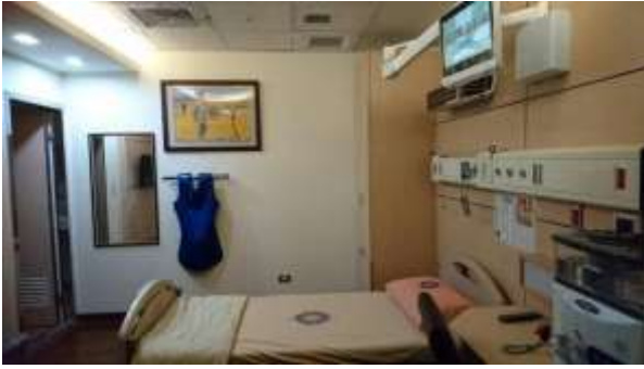
碘 131 病房