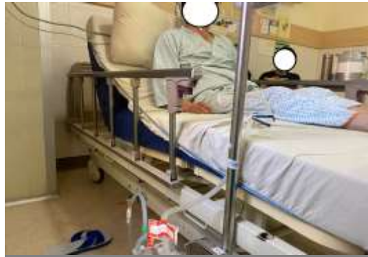
圖四 半坐臥，以利肋膜積液引流

採半坐臥式，可促進肺部擴張，並每 1-2 小時翻身，以利肋膜積液的引流，見圖四。