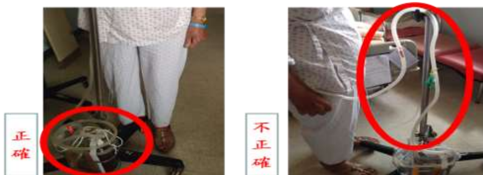
圖九 胸管自然下垂引流