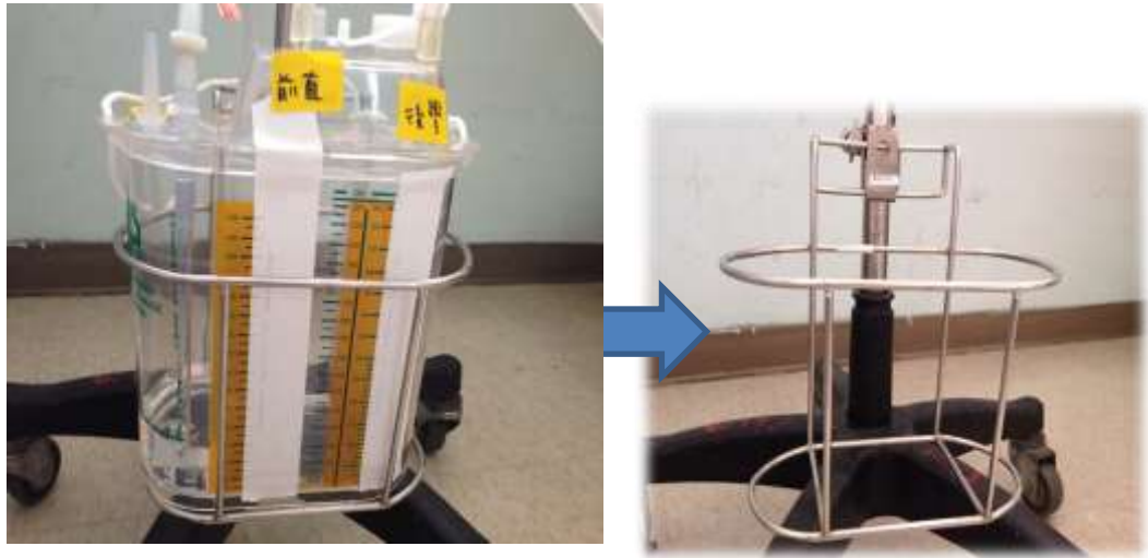
圖八 胸腔引流瓶固定方法