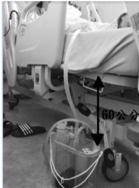
圖一 胸瓶應低於病人胸管置入處