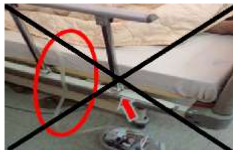
圖六 胸管勿穿、跨越床欄