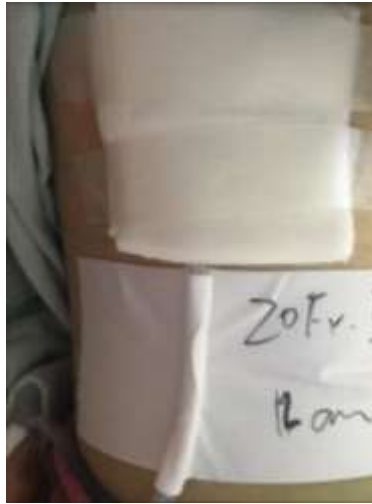
圖二 胸管以布膠固定於 Y 型紗布下方