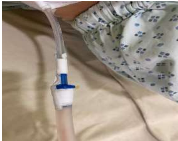
圖三 胸管與連接管間以布膠固定牢靠