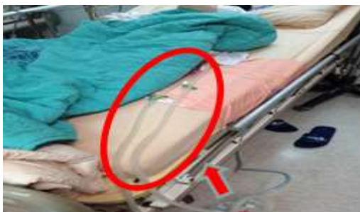
圖五 胸管平放於床面