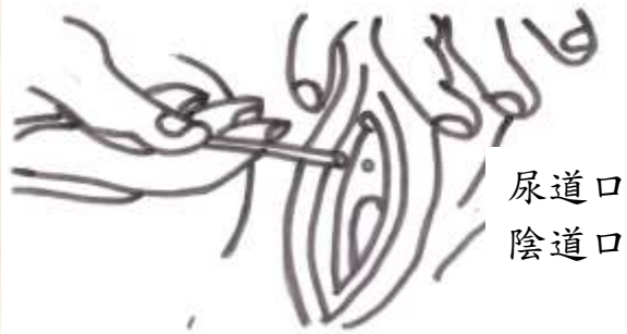
圖八 放入導尿管約 5-7 公分