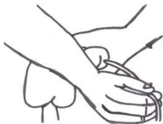
圖四 右手拿尿管的前端，緩緩的將導尿管放入約 20 公分