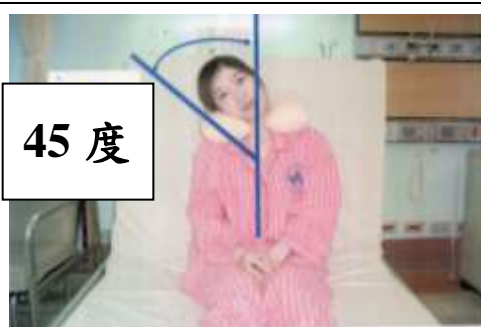
圖八、坐姿頭右傾斜 45 度